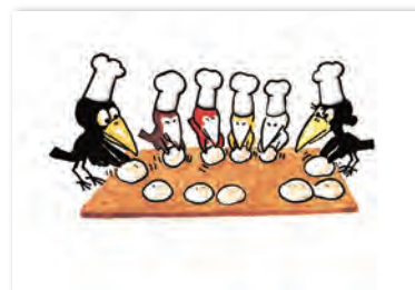
『からすのパンやさん』1973年 ©1973 Kako Research Institute Ltd.

○休館日 7月26日(火) ※状況により会期・開館時間等が変更になる場合があります。 ※会期中の土日祝および8月29日(月)～9月4日(日)は一部【オンラインによる入場日時予約】が必要です。