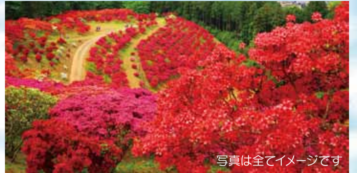
写真は全てイメージです

ネモフィラの花々と空と海の青が溶け合う風景はまさに絶景です。笠間つつじ公園では山一面に8,500株の様々なつつじを楽しめます。ドライブインでのお米のすくい取り体験なども楽しめます。(花の開花状況は天候によって変動があります)