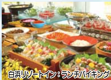
白浜リゾートイン：ランチバイキング

いよいよ潮干狩りのシーズンが近づいてきました。今年も富津海岸へご案内します。お食事は、新鮮な食材をお好きにのせて楽しむ「かってどん」のランチバイキングです。