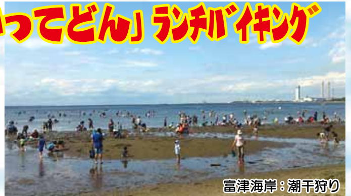
富津海岸：潮干狩り