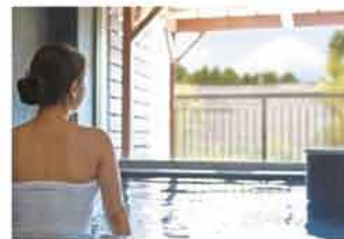
プリンセス富士河口湖 温泉大浴場