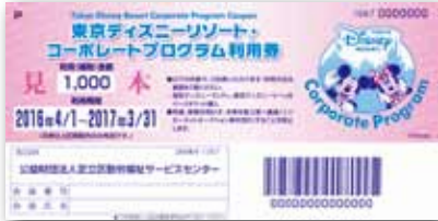
コーポレートプログラム利用券

東京ディズニーランド/ 東京ディズニーシーのパス ポートが1,000円引き で購入できます!